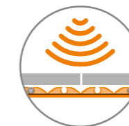
Redução do ruído de impacto